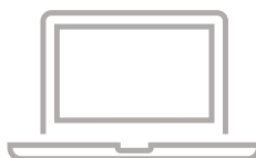
パソコン (簡易自動精算システム インストール済)