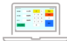
簡易自動精算システム